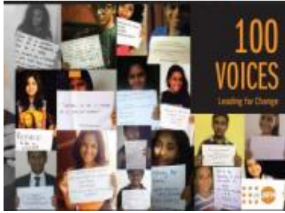
100 Voices වෙනසක් ඇතිකිරීම සඳහා වූ විශේෂ ව්‍යාපාරය (2015)