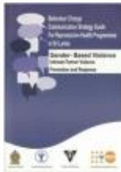
ශ්‍රී ලංකාවේ ප්‍රජනන සෞඛ්‍ය වැඩසටහන් සඳහා වර්ගාවන් වෙනස් කිරීමේ සන්නිවේදන ක්‍රමෝපායයන් (2014)