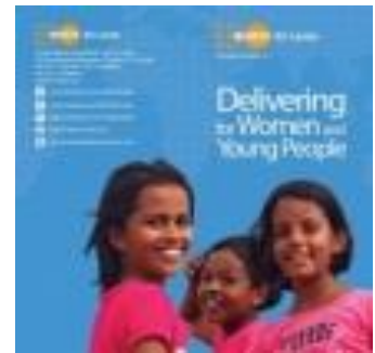
Delivering for Women and Young People (2014) කාන්තාවන්ට සහ තරුණ ජනතාවට සේවා ලබාදීම