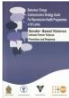
ශ්‍රී ලංකාවේ ප්‍රජාතන සෞඛ්‍ය වැඩසටහන් සඳහා වර්ගාවන් වෙනස් කිරීමේ සන්නිවේදන ක්‍රමෝපායයක් (2014)