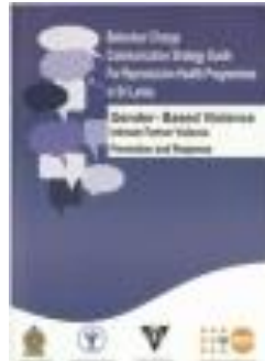
Behaviour Change Communication Strategy for Reproductive Health Programmes in Sri Lanka (2014)