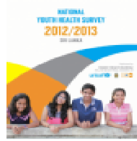
National Youth Health Survey 2012/2013 (2016)