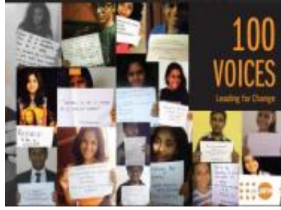
100 Voices Campaign Leading for Change (2015)