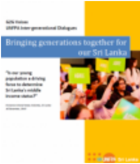
Generation to Generation Dialogue Available in Sinhala and Tamil (2015)