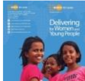
Delivering for Women and Young People (2014)