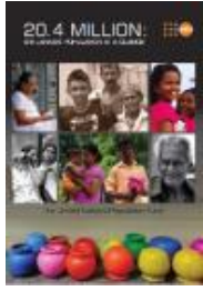
ශ්‍රී ලංකාවේ මිලියන 20.4 ජනගහනය පිළිබඳ සාරාංශයක් (2015)