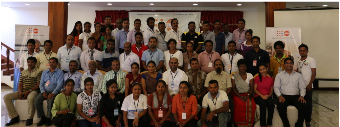
2016 ජූලි 15-16 දෙදින තුළ ඇඹිලිපිටියේදී පැවැත්වූ උපදේශන සාකච්ඡාවේදී ලබාගත් සමූහ ඡායාරූපය

පළමු පියවර ලෙස රාජ්‍ය අංශය, පෞද්ගලික අංශය, සිවිල් සමාජය, ආගමික නායකයින් මෙන්ම තරුණ නායකයින් ගෙන් සමන්විත පුද්ගලයින් එක්කර ගනිමින් බහුවිධ පාර්ශවකරුවන්ගේ ඉහළ මට්ටමේ උපදේශන සාකච්ඡාවක් කැඳවන ලදී. ප්‍රතිපත්ති සකස්කිරීමේදී තරුණ සහභාගිත්වය පිළිබඳ වත්මන් ප්‍රවණතාවයන් සහ පරතරයන් හඳුනාගැනීම සඳහා ඔවුන් තම විශේෂඥ දැනුමෙන් සහ සිය දර්ශනයෙන් දයකත්වය සපයන ලද අතර ඔවුන් යොවනයිනට අදාළව රැකියා, අධ්‍යාපනය, ප්‍රජාතක සෞඛ්‍යය, සමාජ සහ සිවිල් සහභාගිත්වය සම්බන්ධයෙන් පුළුල් ලෙස සාකච්ඡා කරන ලදී.