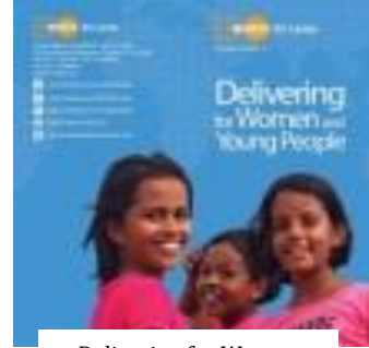
Delivering for Women and Young People (2014)