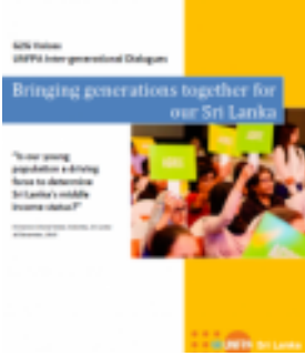
Generation to Generation Dialogue Available in Sinhala and Tamil (2015)