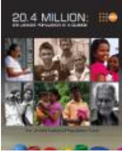
20.4 Million: Sri Lanka's Population at a glance (2015)