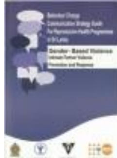
Behaviour Change Communication Strategy for Reproductive Health Programmes in Sri Lanka (2014)