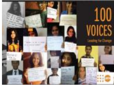
100 Voices Campaign Leading for Change (2015)