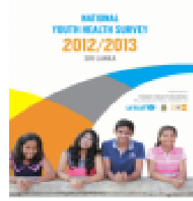
National Youth Health Survey 2012/2013 (2016)